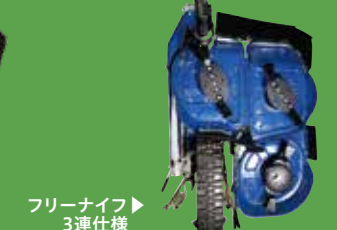
▲フリーナイフ仕様