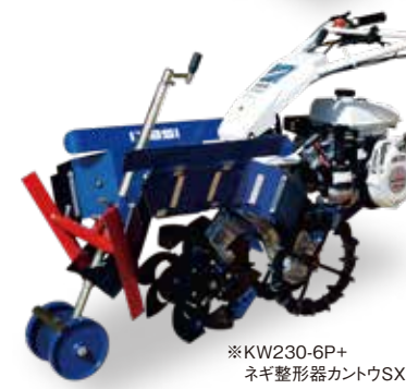
アタッチメント 装着状態